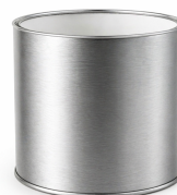
Envase 600 gr