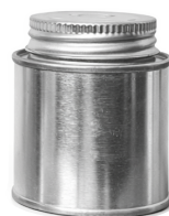
90 ml roscado