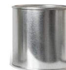
1/8 Litro P/S

Capacidad: 250 ml ø: 211 Pzas por atado: 30