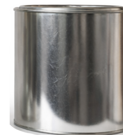
1 1/2 Litros P/S

Capacidad: 2,000 ml ø: 508 Pzas por atado: 10