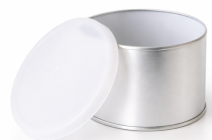
Envase 14 oz