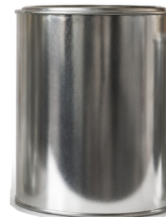
2 Litros P/S

Capacidad: 3,000 ml ø: 610 Pzas por atado: 10