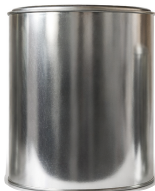
3 Litros P/S

Capacidad: 4,000 ml ø: 610 Pzas por atado: 10