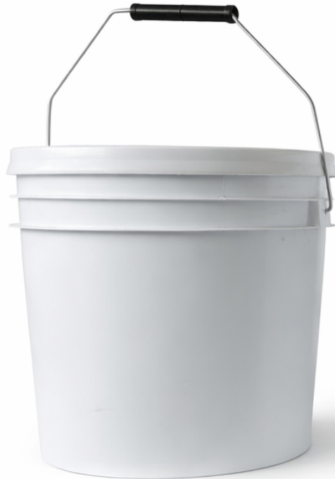
4L con asa metalica