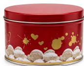
Galletero 120 gr