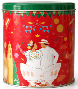
Envase 680 gr