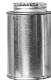
1/4 L Roscado