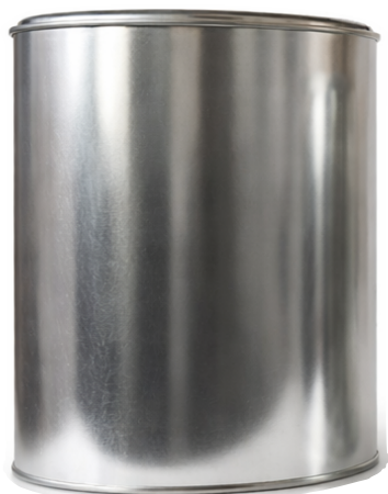
4 Litros P/S

Capacidad: 4,000 ml ø: 610 Pzas por atado: 10