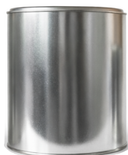
1/2 Litro P/S

Capacidad: 1,000 ml ø: 404 Pzas por atado: 24