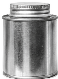
1/8 L Roscado