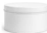
Envase 400 gr