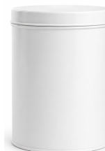
Envase 800 gr