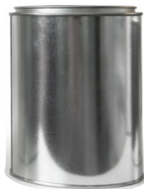
1 Litro T/P

Capacidad: 3,785 ml ø: 610 Pzas por atado: 10