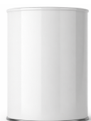
Envase 300 gr