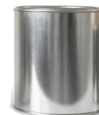
1/4 Litro P/S

Capacidad: 500 ml ø: 307 Pzas por atado: 30