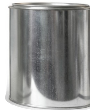
1/4 Galón T/P

Capacidad: 1,000 ml ø: 404 Pzas por atado: 24