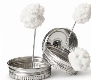
Tapa 1 1/3 con borla