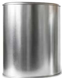
1 Litro P/S

Capacidad: 1,500 ml ø: 508 Pzas por atado: 10